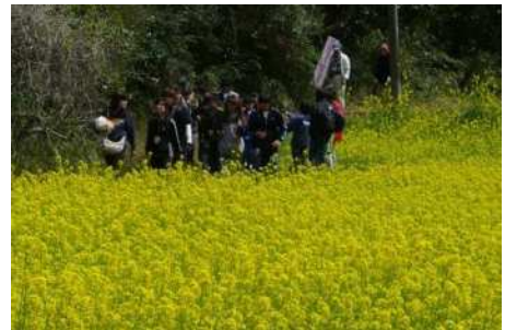
植栽した菜の花 春の風景