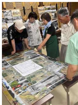
農村風景の今昔写真展

A：少子高齢化が進み、十数年後には農村環境の維持が難しくなることを踏まえ、先人の土地改良事業の功績や、氏神さん祭祀と農業との関わりを、数少ない子どもたちに伝える活動を始めました。