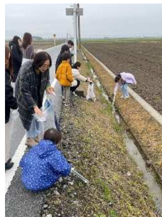
ゴミ拾い活動の様子

A：農業と自然環境、動植物との関係や、天候や山、河川などとの地理的な関係、農業環境の歴史的な経緯について、県立琵琶湖博物館やインターネットで調べ知識を深めています。また、日常の農村風景を写真に残すよう心掛けています。