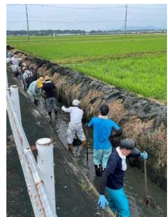
泥上げ活動の様子