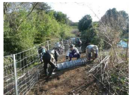
イノシシ防護柵の設置