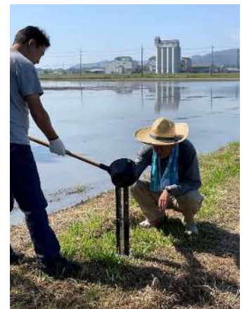
排水の透視度調査の様子

A：前任の方々のおかげで、構成員の方々の理解と協力を得ているので、役員の意向どおりに運営させていただいており、苦労は少ないです。農事改良組合や営農委員会と構成員が一致しているので意思疎通も図りやすいです。