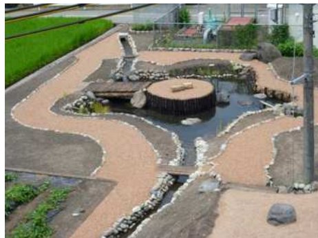
地域住民で造成したビオトープ (造成当時の写真)