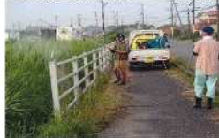
主要水路への除草剤散布 6月18日