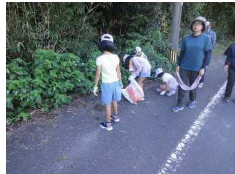
清掃活動の様子（子供クラブ）