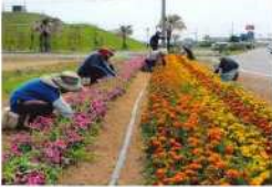
5. マリーゴールド・日々草の生育管理 保育所北側（草取り作業中） 7月2日