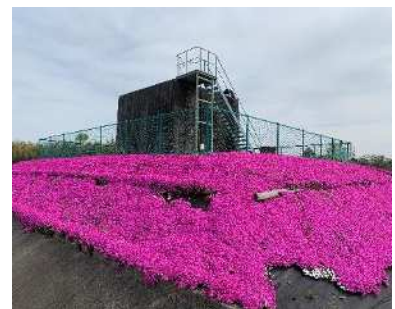
景観形成活動（シバザクラ）