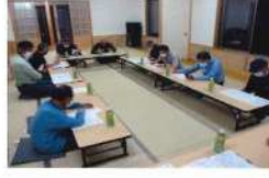
2. 役員会議 第2回役員会議（野中区民館） 5月29日