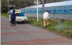
6. 水路・農道への除草剤散布 主要水路への除草剤散布 4月19日