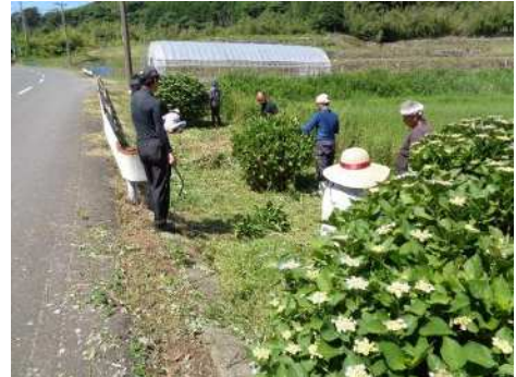
景観保全活動（あじさい剪定）