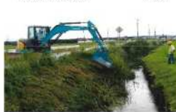
モアによる作業委託 7月9日