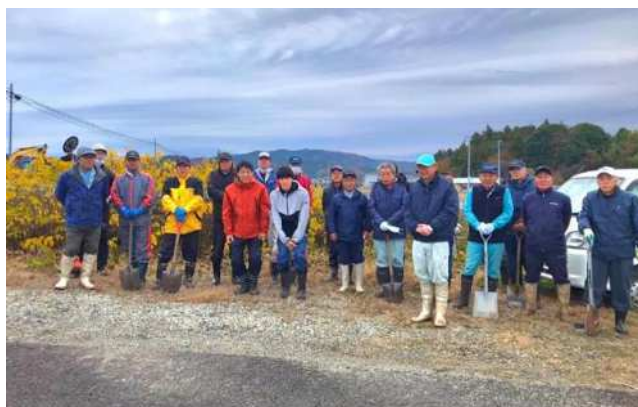
大学生が参加した水路清掃

引き続き TANOPO を活用し、活動組織と都市住民や企業との新たなつながりの創出など地域の共同活動の継続に向けた取組を推進していきます。