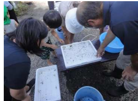
生き物調査（子供クラブ）