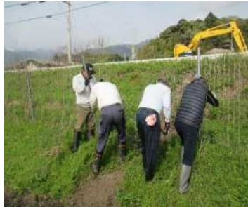
獣害対策（防止柵の設置）