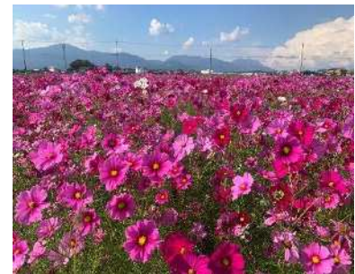
景観形成活動（コスモス）