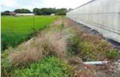
7. 水路・農道の草刈り 作業前 7月8日