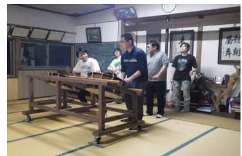
お囃子の練習の様子