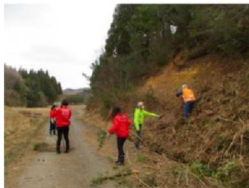
学生が参加した獣害対策