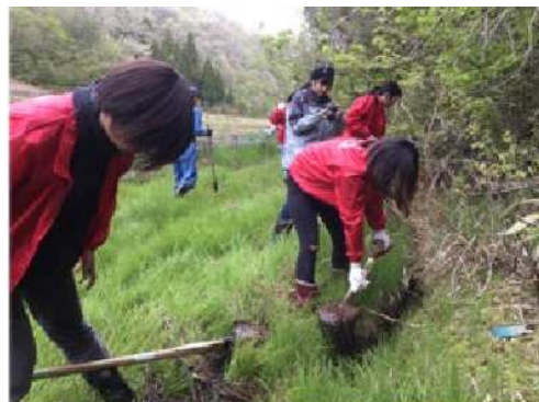
学生が参加した水路の泥上げ