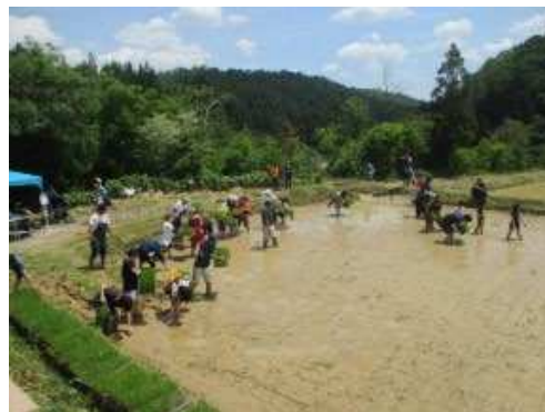
伝統的農法による田植え