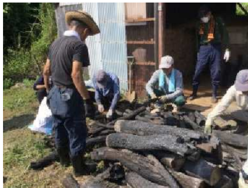
伐採した雑木を使用した炭づくり