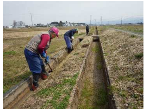
水路の泥上げ作業