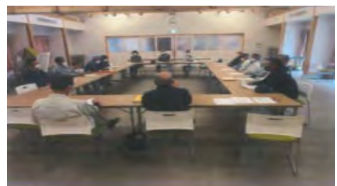
集落活動センターで役員会を開催