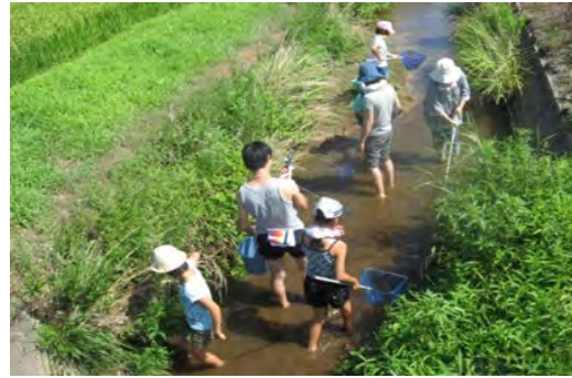
水路での生きもの調査

これからも、地域の財産である子や孫を大切にしながら、農地や水路・農道等の地域資源を良好な状態で次世代に継承するとともに、農業後継者の育成にも引き続き取り組みたいと考えています。