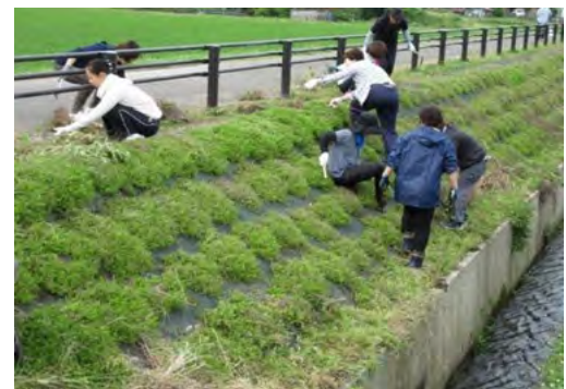
婦人会が中心となった植栽活動