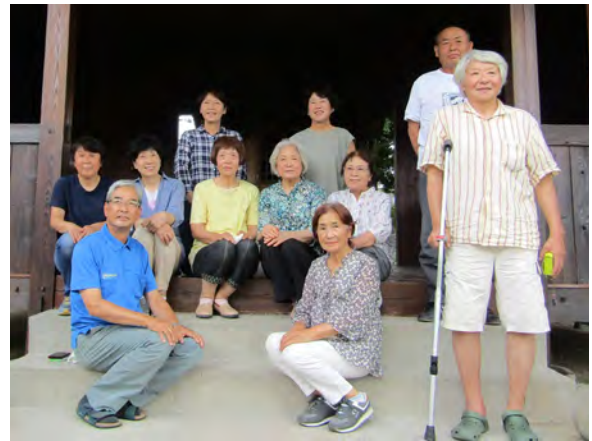
おおいちく 大井地区環境保全会のみなさん

活動範囲：田 60.11 ha、畑 0.22ha 対象施設：水路 6.0km 農道 4.1km 活動開始時期：平成 26 年～