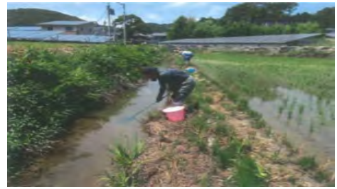
スクミリンゴガイの駆除

※集落活動センター：地域住民が主体となって、地域外からの人材も受け入れながら、旧小学校や集会所等を拠点に、それぞれの地域の課題やニーズに応じて様々な活動を総合的に取り組む仕組みで、高知県に62箇所(R3.4時点)開所。