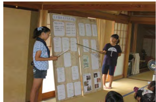
調査結果の発表(環境学習会)