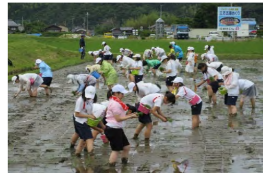
県外の中학생との田植え体験