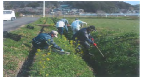
ノカンゾウ苗の植栽