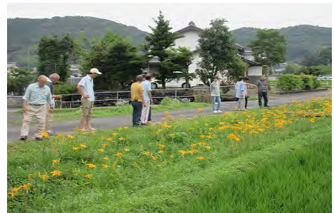
ノカンゾウの鑑賞